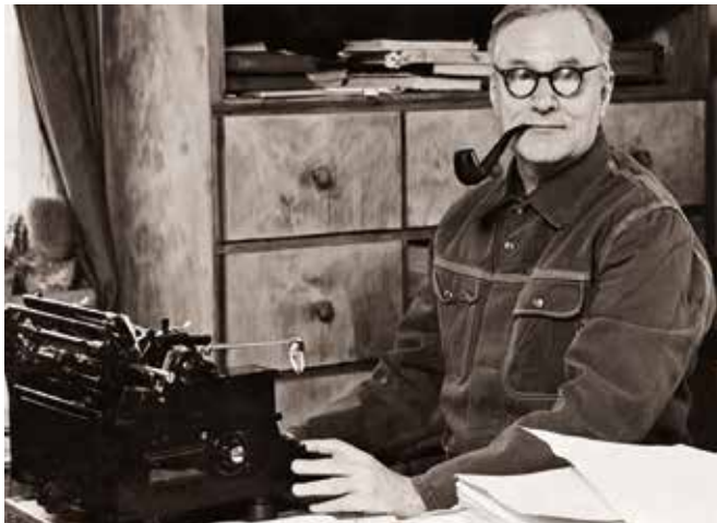
Hans Scherfig (1905–79)