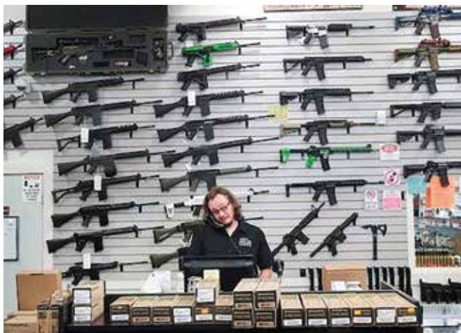
Der sælges fortsat våben i USA til tosser og andet godtfolk.

Det loveede virkelig ikke så lidt. Den herre, hvis navn det lød på, titulerede sig selv "Kommissionær", og han ville påtage sig ikke blot at skille folk og at skaffe mænde-